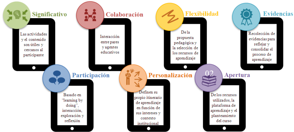
Figura 2. Características del curso PREA