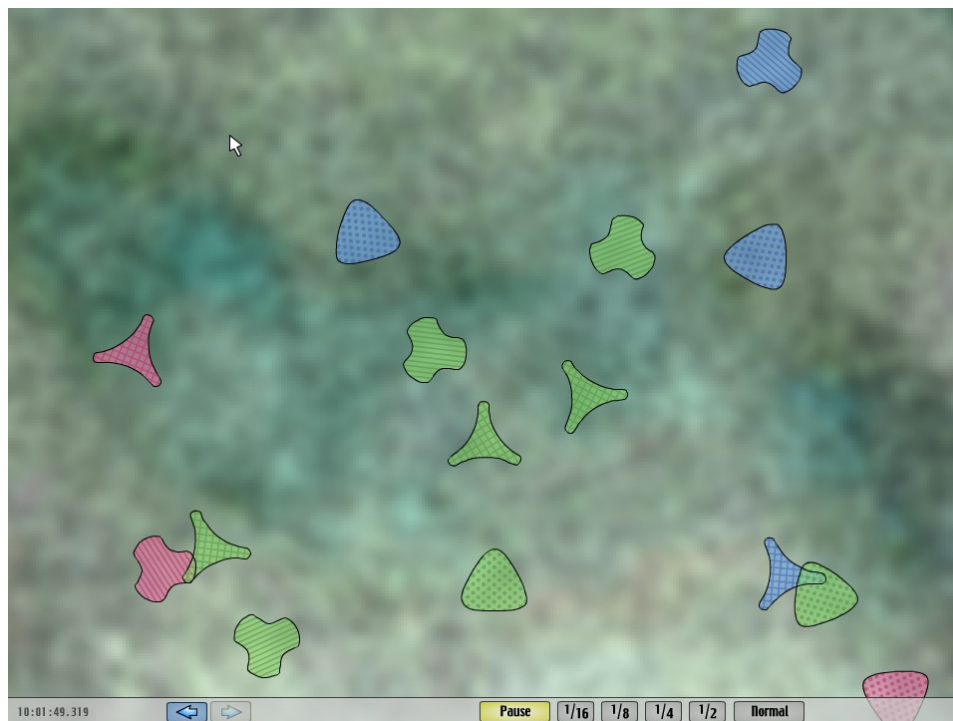
Figure 1. La simulation adisciplinaire Les Bidules .

La première (figure 1), que nous nommerons les Bidules , présente trois types d'entités de forme géométrique simple mais abstraite (ce qui les rend très difficiles à nommer), se déclinant en trois couleurs, qui se déplacent selon des trajectoires courbes; formes et trajectoires sont définies par des règles arbitraires et (ou) aléatoires. Lorsque deux entités se rencontrent, chacune peut changer de couleur, selon une probabilité différente suivant qu'elles sont de même couleur ou non. Ces choix relatifs aux formes et aux trajectoires découlent de notre expérience avec une série de simulations développées et expérimentées antérieurement (Couture et Meyer, 2008). Nous avons alors constaté que des formes géométriques élémentaires, comme des cercles ou des sphères, bien que purement géométriques (donc non disciplinaires), revêtaient une connotation disciplinaire en vertu de leur utilisation fréquente dans les représentations scientifiques conventionnelles (atomes, planètes, etc.). De même, des trajectoires régies par des relations semblables à celles des lois de la physique (par exemple, la force d'un ressort) étaient facilement reconnues comme telles. En fait, le seul élément ayant été volontairement soustrait à l'évitement disciplinaire est la couleur, qui n'est pas une caractéristique mathématique : celle des entités, mais aussi celle du fond, dont la forme est toutefois le résultat d'un calcul mathématique.