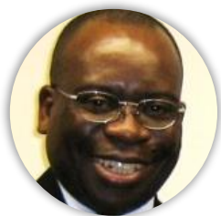
Ndugumbo Vita Université Laval